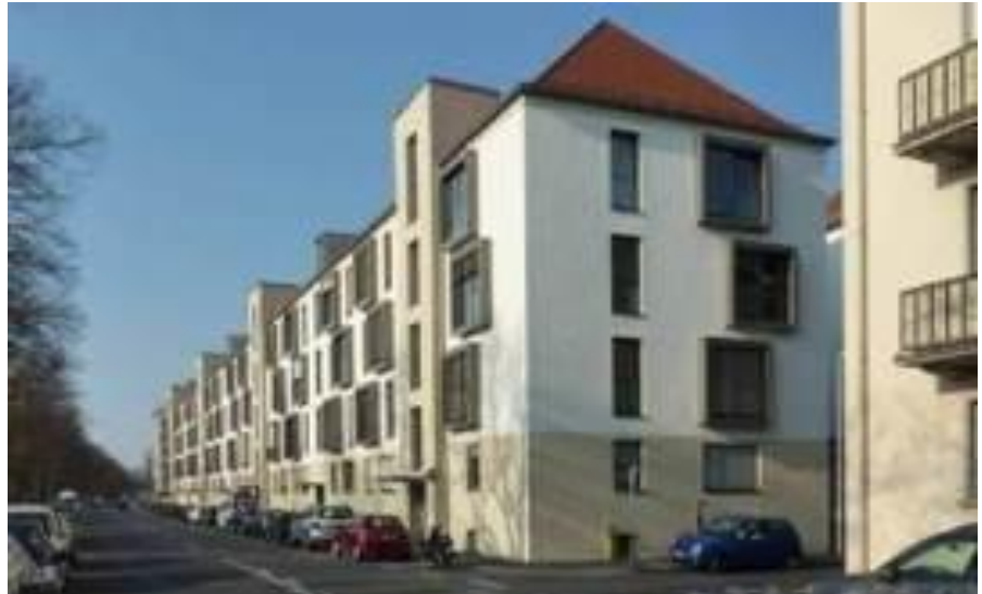
Erster Bauabschnitt am Ludwigkai